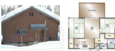
場所：飯綱町大字川上2755番1063 価格：250万円 間取り：2DK