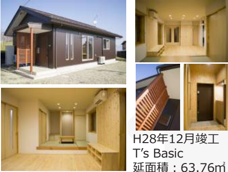
H28年12月竣工 T's Basic 延面積：63.76㎡