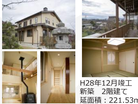
H28年12月竣工 新築 2階建て 延面積：221.53㎡