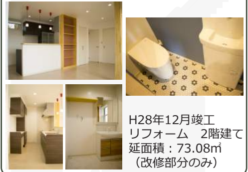
H28年12月竣工 リフォーム 2階建て 延面積：73.08㎡ (改修部分のみ)