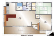
場所：飯綱町 大字川上 2755-1578 価格：480万円 間取り：2LDK