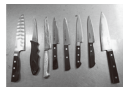
ピカピカになった包丁達