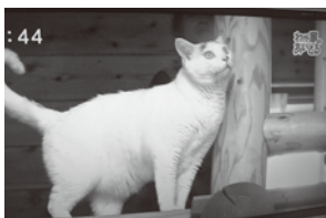
ペットの猫ちゃんミルク 某テレビ番組の 『わが家のアイドル』に出演