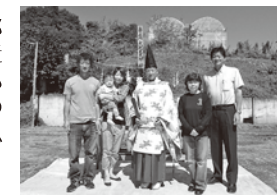
地鎮祭でお施主さんと