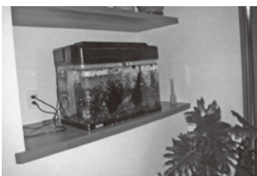
玄関横の水槽スペース

イクを発見しました。去年、息子さんご夫婦と一緒にバイクの免許を取って、現在、家の周囲で練習中。将来は北海道へツーリングへ行きたいと楽しそうにお話いただきました。とても仲の良いご家族です。最後にファースの家の住みごこちを聞いてみると、冬が一番実感できるとの事。外出して家に戻った時に家の中が暖かい、と一番に挙げて頂きました。押入れの中の臭いも気にならない、急にお客様が来ても収納にあったお布団をそのまま使えども。いつまでもご家族が仲良く、健康・安全で暮らして頂ける家造りを社員一同・仕事をしていかなければ、と改めて感じました。