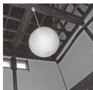
茅葺が見える天井

い。酒屋はワイン・焼酎の種類も以前より増え、ご主人が大好きなバーボンも置いてあります。巷で有名な高坂りんごを使った高坂りんごシードルもありますよ。おじいちゃんは厳しい状況で何となく酒屋をやめてしまおうかと思ったこともあったそうです。でも、今までやっていて良かったと、継続することの大切さ・地元へ貢献できることの有り難さを語って下さいました。どんな商売でも同じなんですね。元気なおじいちゃんは、今日も軽トラで、あなたの玄関先まで配達していますよ〜。