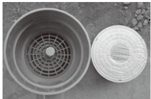
家の裏にこんなものがありますよ

台所、浴室、洗面所、洗濯機の排水は外の排水マス(目皿付トラップマス)に流れますが、その排水マス内の目皿(棒の付いたもの)にゴミが溜まっていると、詰まったり、溢れる原因となります。雪が積もる前に、目皿を取り出しゴミを取り除きましょう。(各ご家庭で春先と初冬の年2回は確認作業をする習慣を)