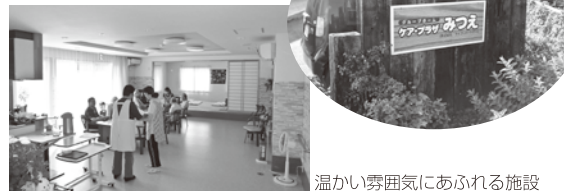
温かい雰囲気にあふれる施設