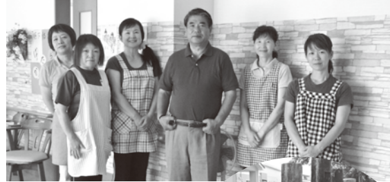
笑顔が素敵なスタッフ